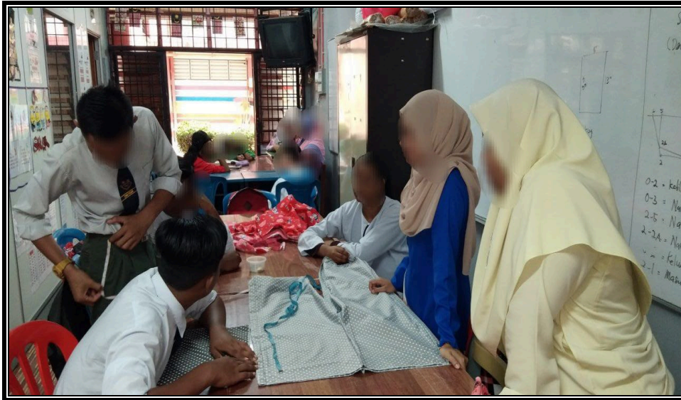
Gambar 2 Kelas Penyelenggaraan Mesin Jahit Dari Individu Luar