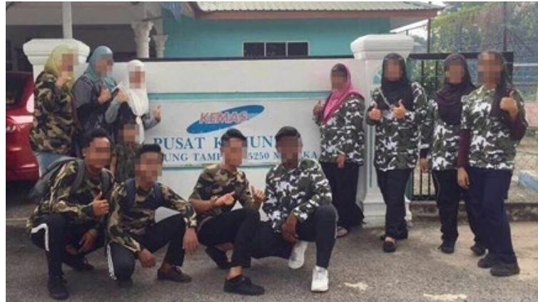
Gambar 4 Kelas Jahitan Bersama Komuniti

Murid berkeperluan khas dibawa ke tempat latihan kemahiran komuniti jahitan yang sebenar serta melaksanakan aktiviti jahitan bersama masyarakat. Dengan ini secara tidak langsung murid akan merasai sendiri suasana pembelajaran yang disediakan oleh komuniti luar dan memberi peluang masyarakat memahami keadaan sebenar murid berkeperluan khas. Melalui penglibatan sosial antara dua pihak ini, ramai yang mula menerima dan mempunyai kesedaran tentang bakat kebolehan anak-anak berkeperluan khas dalam bidang jahitan. Malah setelah beberapa kali kelas jahitan dijalankan di Pusat Latihan Kemahiran Komuniti KEMAS, ada pelajar berkeperluan khas yang sudah berani mengikuti kelas jahitan sendiri tanpa kehadiran guru bersama. Ini menunjukkan bahawa pelajar sudah yakin membuat pilihan dan keputusan sendiri dengan perbincangan bersama ibu bapa dan penjaga mereka. Kepercayaan ini sangat penting untuk majikan yang sedang mencari pekerja dan membuka peluang pekerjaan kepada golongan berkeperluan khas. Keyakinan diri murid juga akan terbentuk secara langsung melalui penglibatan sebegini.