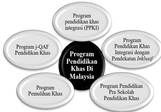
Rajah 1.2 - Program Pendidikan Khas (PK) di Malaysia

GPI perlu mengetahui tentang Program PK yang terdapat di Malaysia, mengetahui dengan lebih jelas tentang konsep serta jenis program tersebut dan seterusnya mengenali sekolah-sekolah yang telah ditubuhkan di Malaysia. Program Sekolah PK merupakan satu program pendidikan yang telah diatur khusus untuk MBK MaL dan pendengaran. Ia ditadbir sepenuhnya oleh Bahagian Pendidikan Khas, Kementerian Pelajaran Malaysia (KPM). Program yang disediakan termasuklah program pendidikan prasekolah, pelajaran rendah, pelajaran menengah, dan pelajaran teknik/vokasional. Terdapat beberapa program yang telah disediakan oleh Bahagian Pendidikan Khas untuk MBK ini. Antaranya ialah: