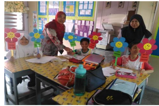
Guru PK memberi penghargaan dan bertindak sebagai pemudahcara ketika PdP sedang dilaksanakan dalam kelas