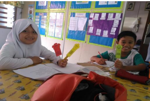
Murid menggunakan 'Traffic Light' sebagai kaedah guru PK mengawal aktiviti dalam kelas cacat pendengaran