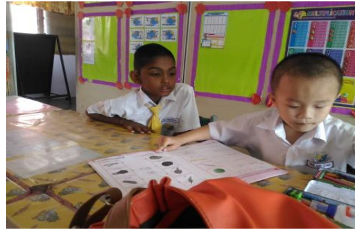
Murid melaksanakan aktiviti, Paired and Share ketika PdP dalam menyiapkan tugas mereka.