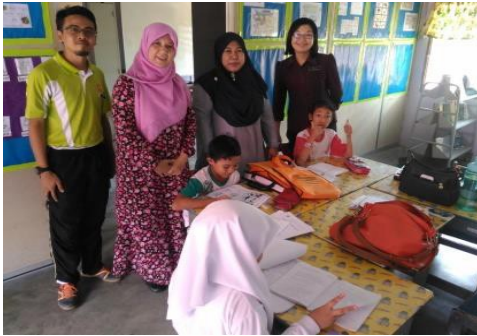
Guru-guru PK berkolaboratif ketika melaksanakan PAK21 dalam kelas murid cacat pendengaran.

Pelaksanaan Pembelajaran Abad Ke-21 oleh Guru-Guru Pendidikan Khas Murid Cacat Pendengaran di Sekolah Kebangsaan Tengku Bendahara Azman 1, satu-satunya sekolah cacat pendengaran di Daerah Klang, Selangor.